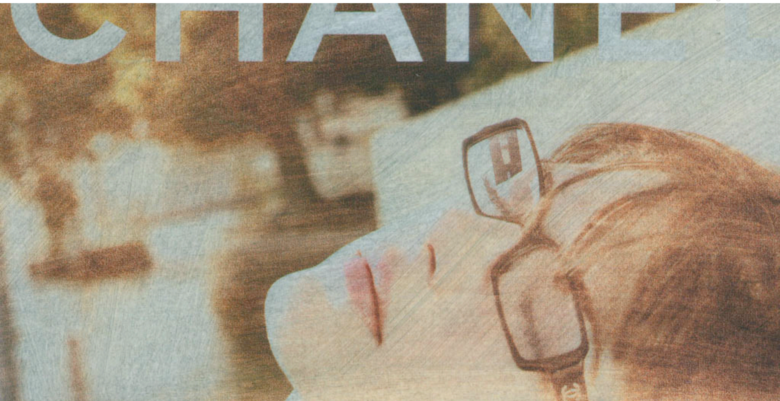
adwork by angelika j. trojnarski

* artful advertising fantasies. aesthetic. challenging.